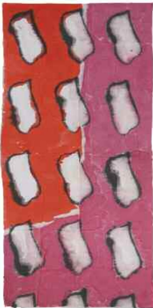
Sans titre 2012 210 cm x 105 cm Acrylique, drap blanc