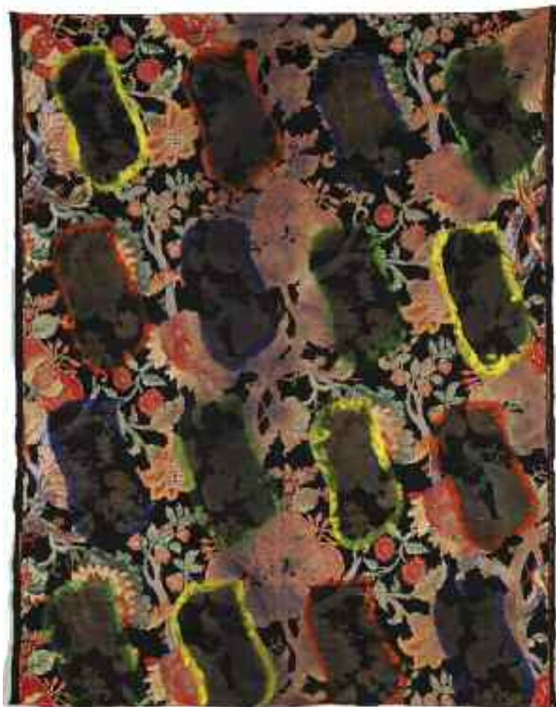
Sans titre 2012 185 cm x 147 cm Acrylique, tissu ameublement