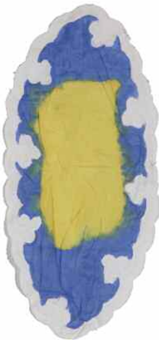
Sans titre 2011 74 cm x 37 cm Acrylique, napperon ovale