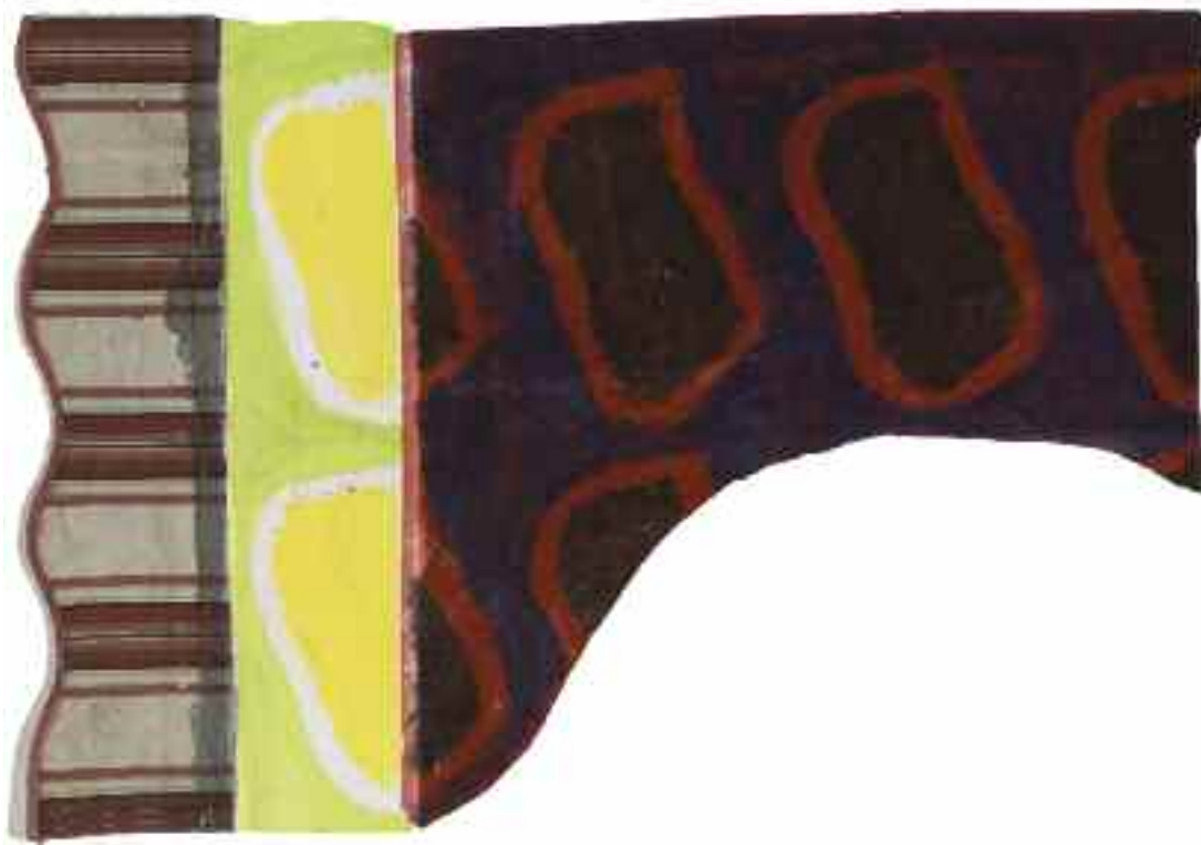
Sans titre 2012 100 cm x 145 cm Acrylique, montage 3 tissus