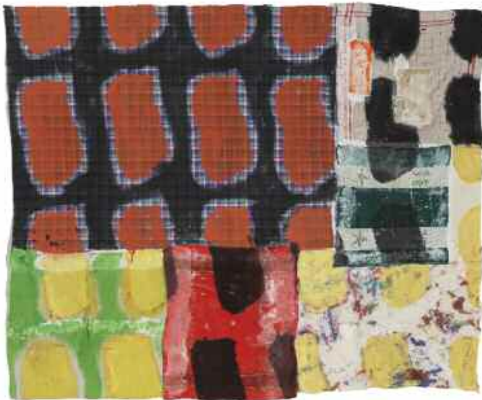
Sans titre 2012 143 cm x 170 cm Acrylique, raboutage