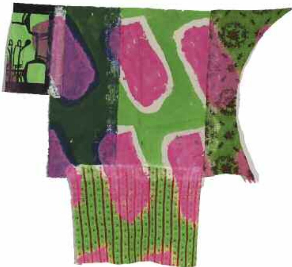
Sans titre 2012 112 cm x 122 cm Acrylique, raboutage 4 tissus