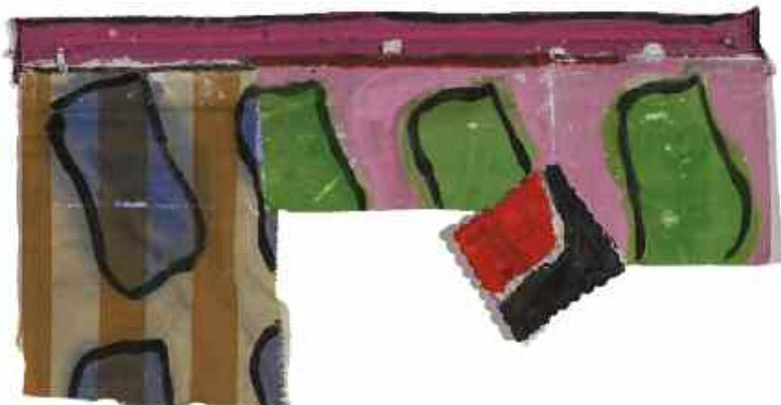
Sans titre 2012 66 cm x 134 cm Acrylique, montage de tissus