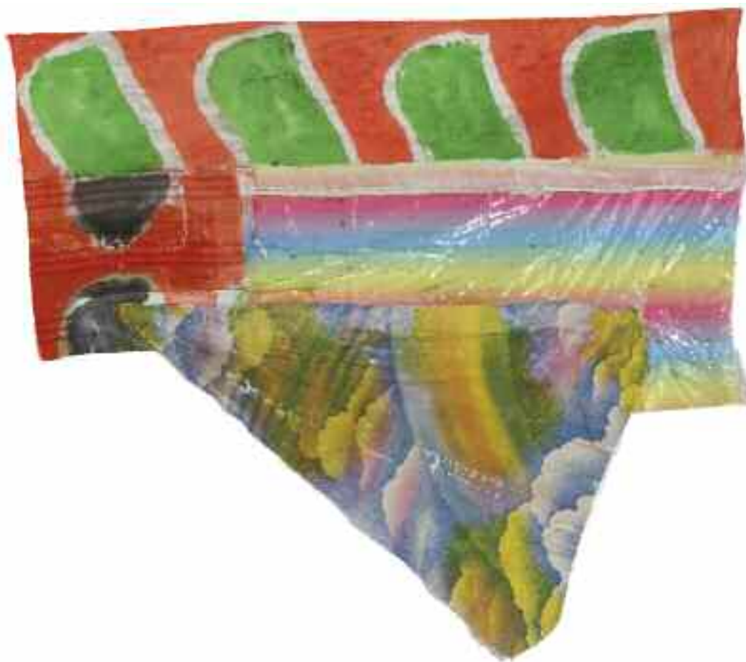
Acrylique, montage 4 tissus Sans titre 2012 125 cm x 140 cm