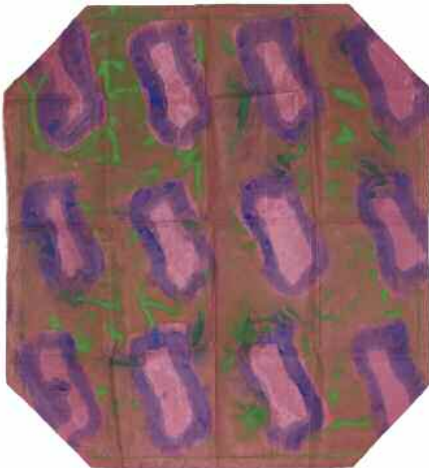
Sans titre 2012 145 cm x 81 cm Acrylique, tissu plastifié