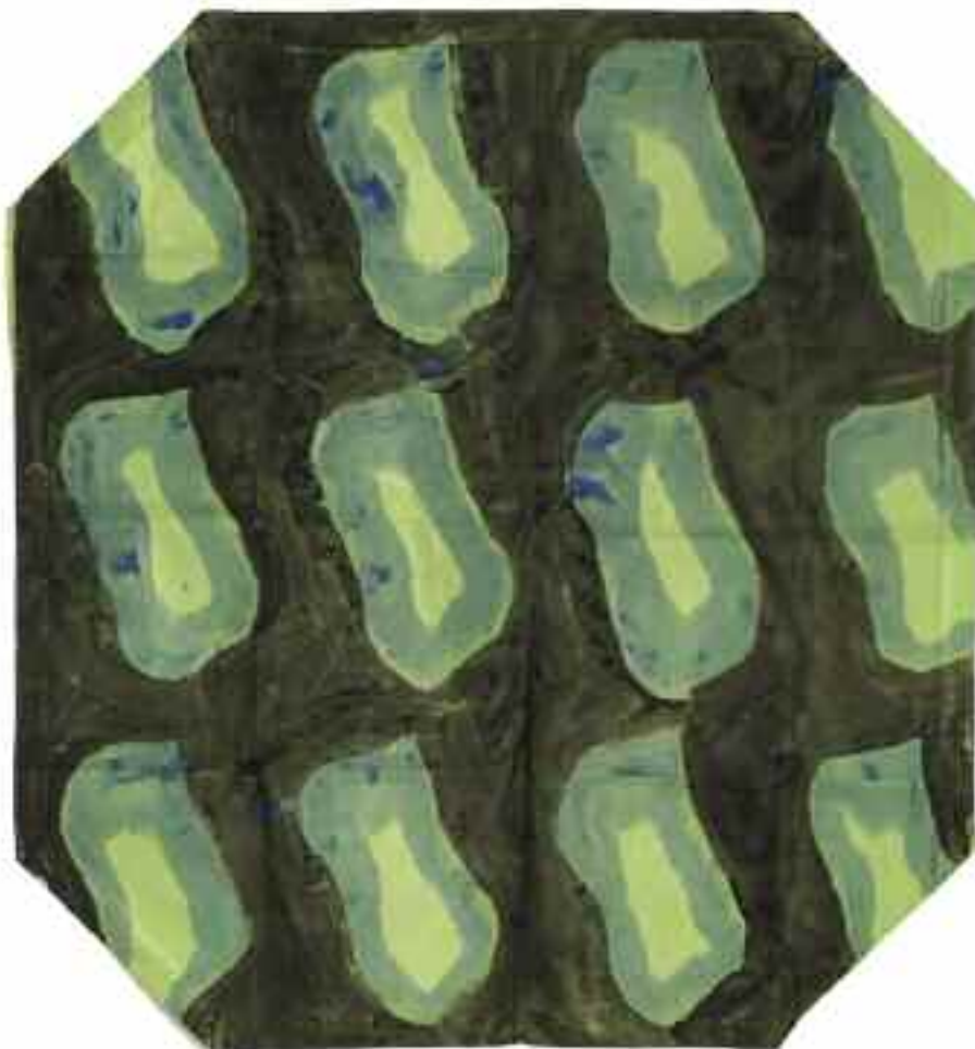
Sans titre 2012 144 cm x 80 cm Acrylique, tissu plastifié