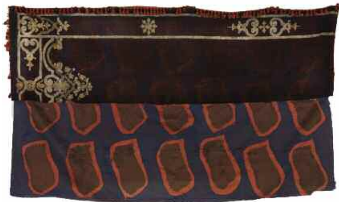
Sans titre 2012 140 cm x 320 cm Acrylique, tissu Hermès