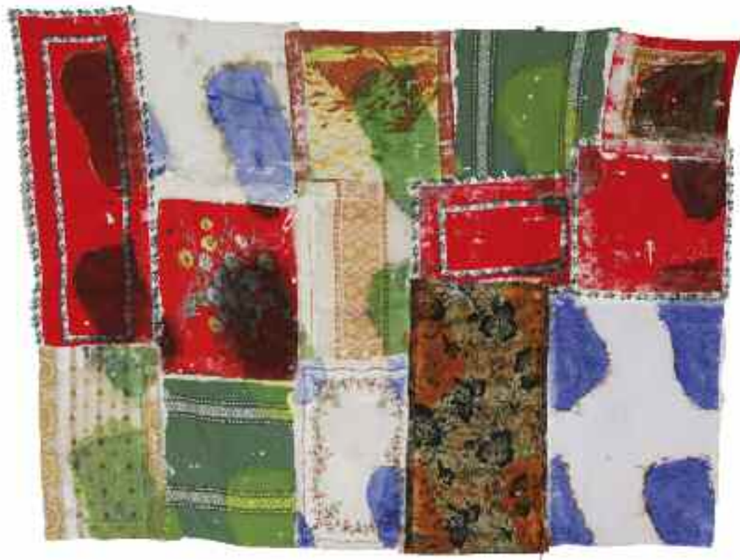
Sans titre 2011 130 cm x 162 cm Acrylique, nappes serviettes, divers