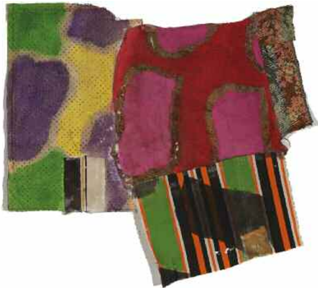
Sans titre 2012 93 cm x 106 cm Acrylique, raboutage