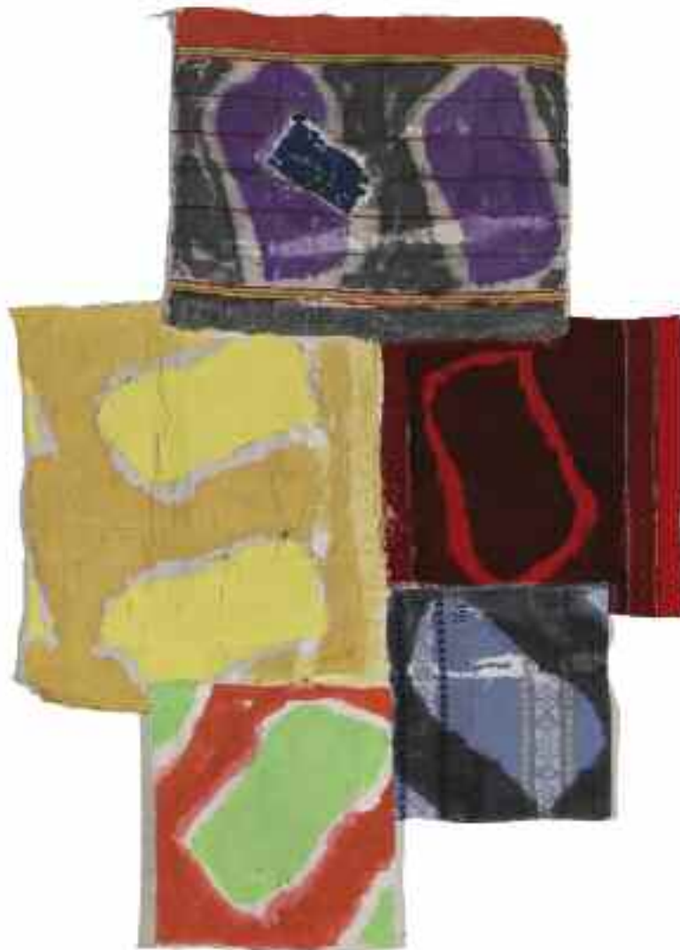
Sans titre 2012 155 cm x 100 cm Acrylique, raboutage