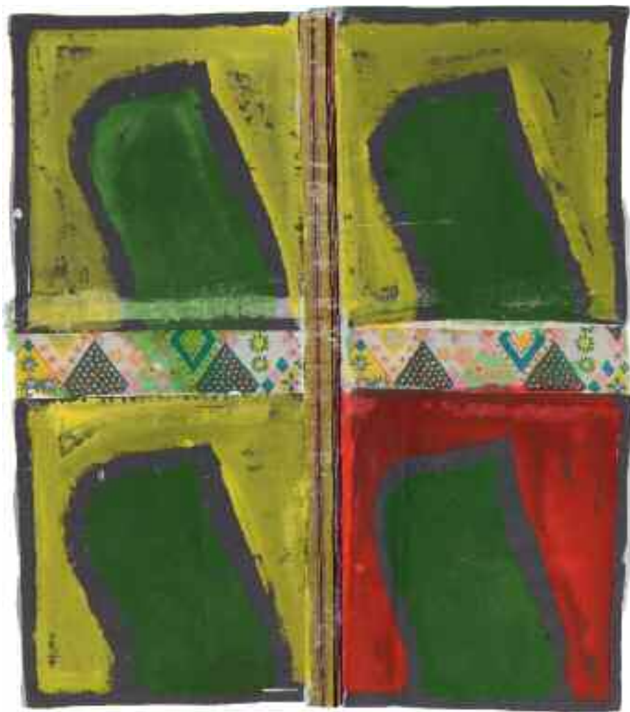
Sans titre 2011 88 cm x 77 cm Acrylique, bâche raboutage