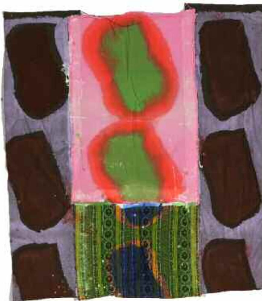
Sans titre 2012 127 cm x 112 cm Acrylique, montage 4 tissus