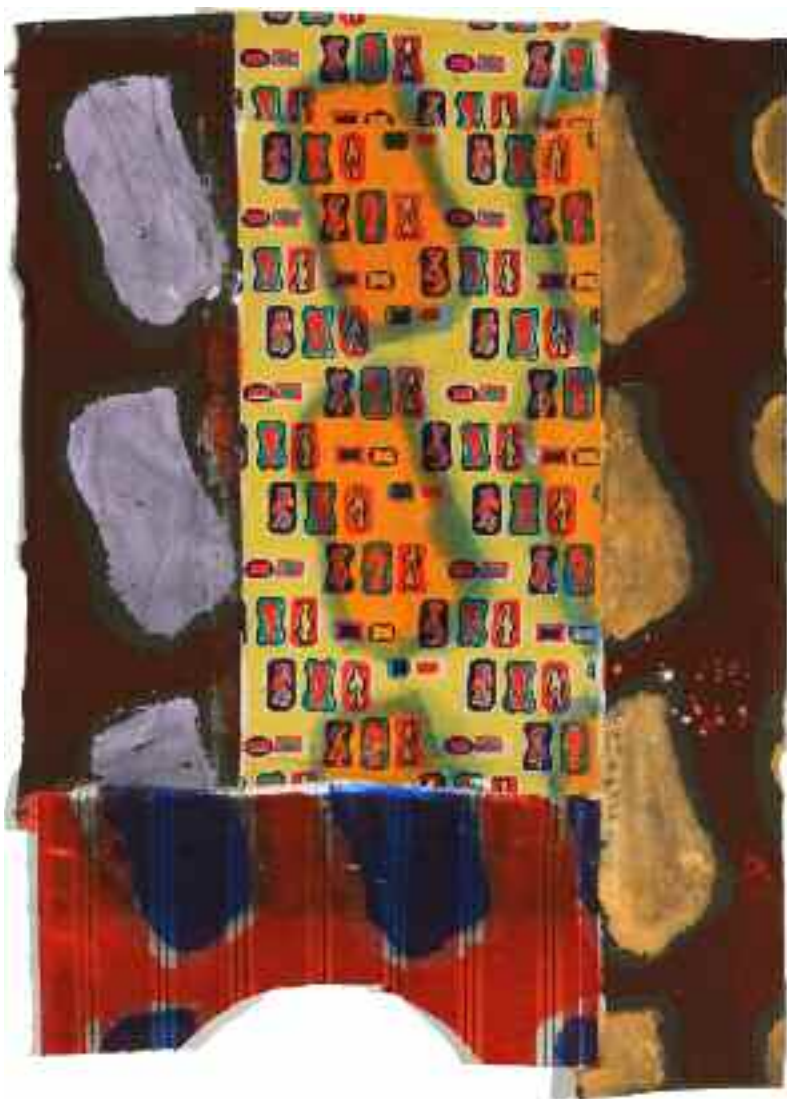
Sans titre 2012 157 cm x 114 cm Acrylique, montage 3 tissus